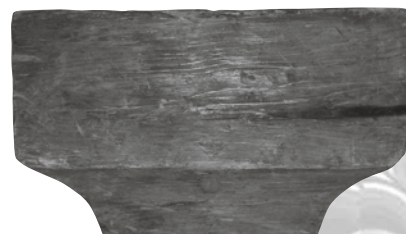
東大寺出土 斗拱未製品 (東大寺蔵、当研究所保管)