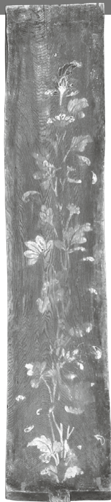
唐招提寺金堂天井 支輪板<国宝> (唐招提寺蔵)