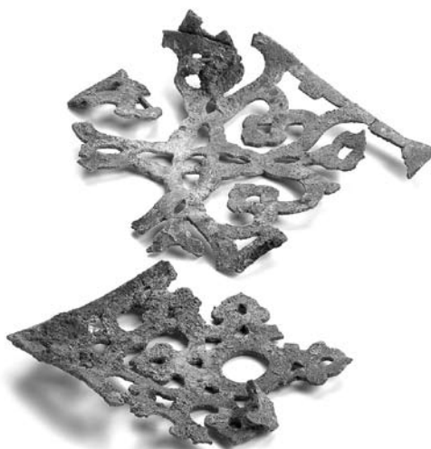
興福寺中金堂院出土 垂木先金具 (興福寺蔵、奈良文化財研究所保管)

本展覧会では、平城京の大寺院を中心におもに考古学の視点から奈良時代の仏教建築の世界を紹介します。さらに出土遺物や伝世資料などから、建造物の建立と荘厳、伽藍の造営に携わった奈良時代のさまざまな「匠たち」の姿に迫ります。